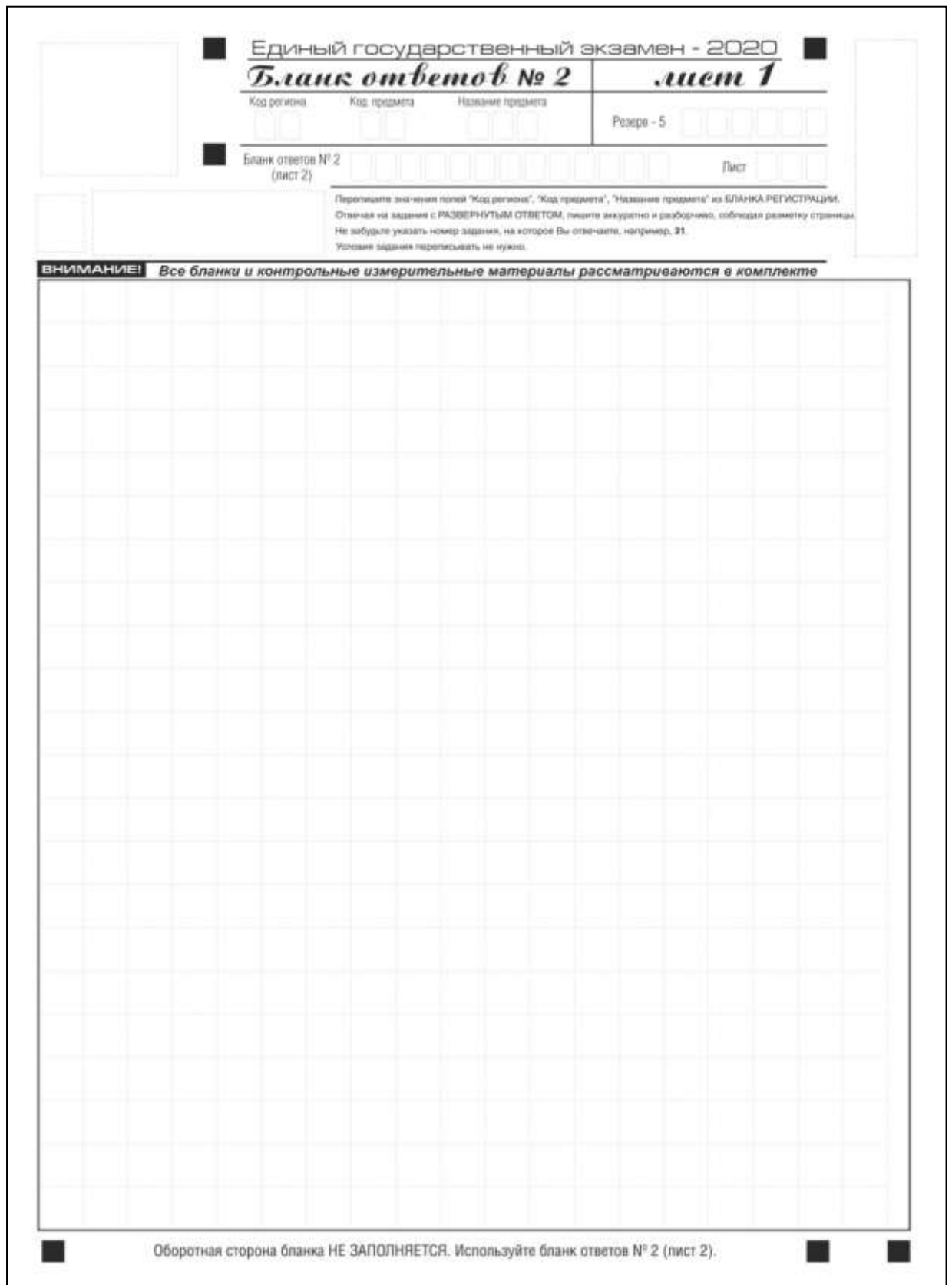
Рис. 12. Бланк ответов № 2 по китайскому языку (лист 1)